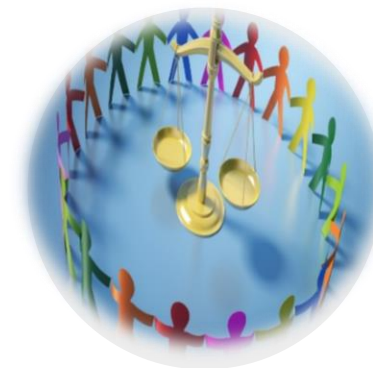
Cittadinanza e Legalità