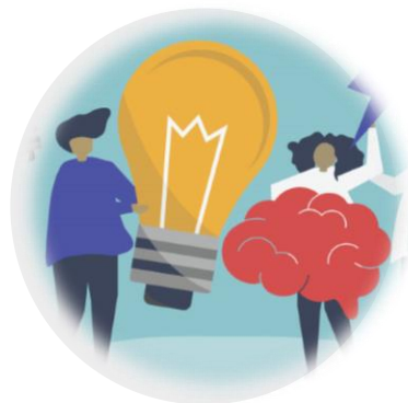
Logica - Matematica